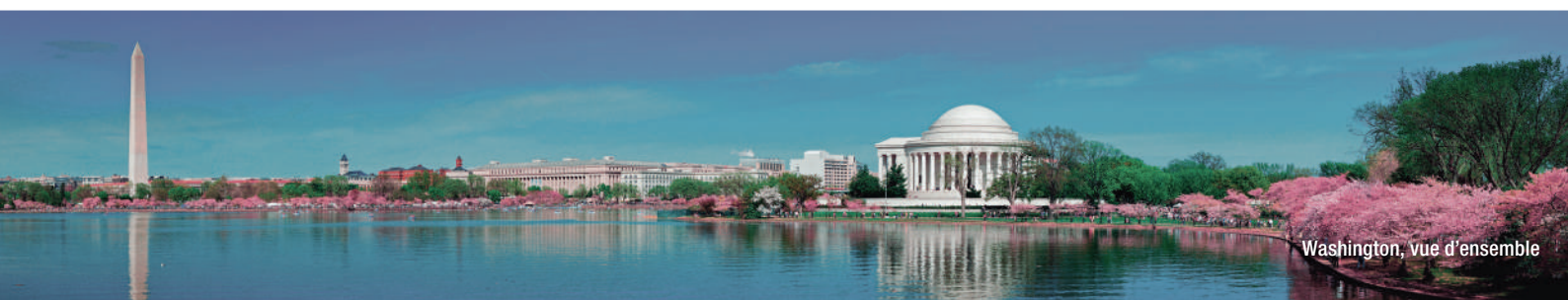
Washington, vue d'ensemble

Elle est surtout réputée pour son université d'État (University of Virginia) dont les plans ont été imaginés par le président Thomas Jefferson lui-même. Grand visionnaire et amoureux de sa région, il pensait qu'aucune nation ne pouvait fonctionner sans élite bien formée. Il se plaisait à dire « knowledge is power » (la connaissance est le pouvoir). Inaugurée en 1819, l'université de Virginie est inscrite au patrimoine mondial de l'Unesco depuis 1987.