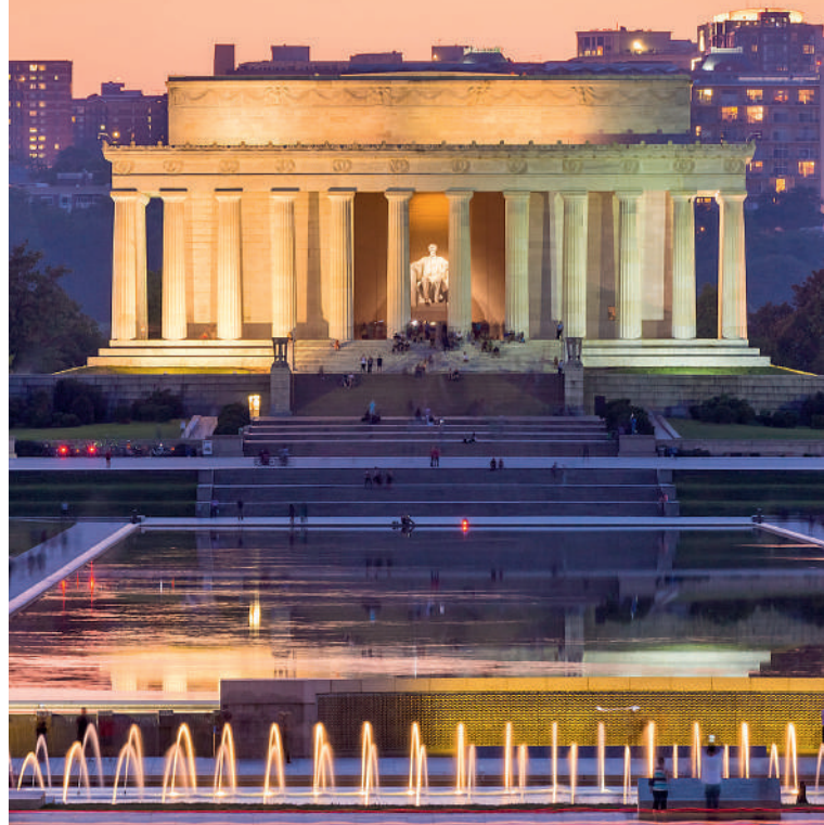
Washington, Lincoln Memorial

Voyage principal, au tarif de 4995 € / personne en chambre double