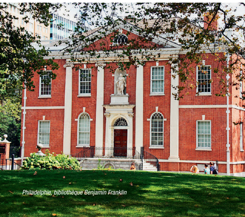
Philadelphie, bibliothèque Benjamin Franklin

https://www.maisonsduvoyage.com/notre-engagement-responsable