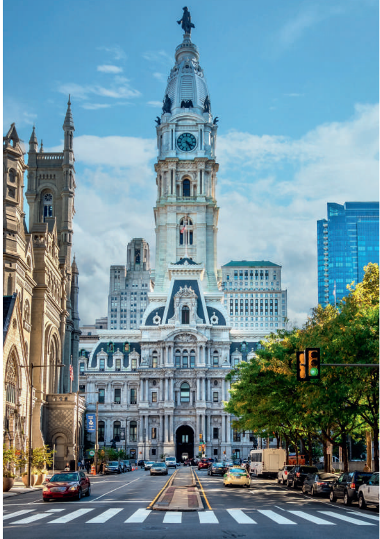
Philadelphie, City Hall

Arrivée jeudi 2 mai 2024 à Paris-Charles de Gaulle en milieu de matinée.