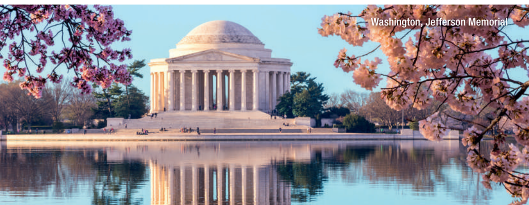
Washington, Jefferson Memorial