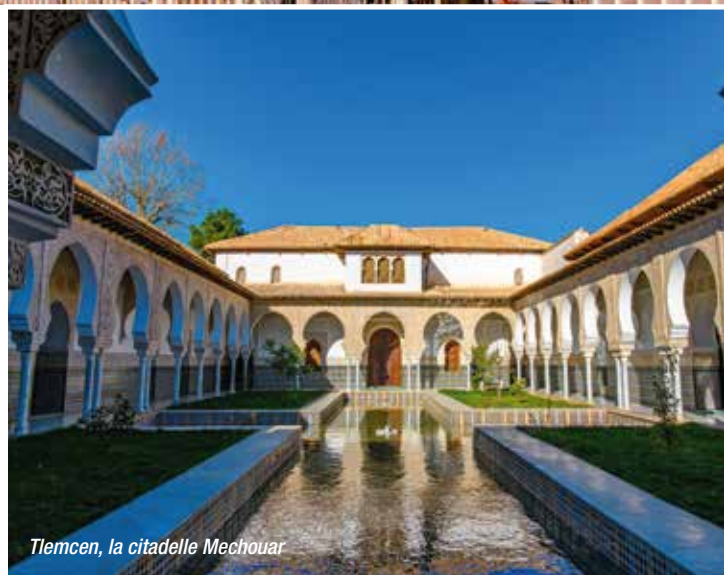
Tlemcen, la citadelle Mechouar

INFORMATION IMPORTANTE : Les ressortissants de l'Union européenne doivent être munis d'un passeport sans cachet israélien, valide plus de six mois après la date du retour.