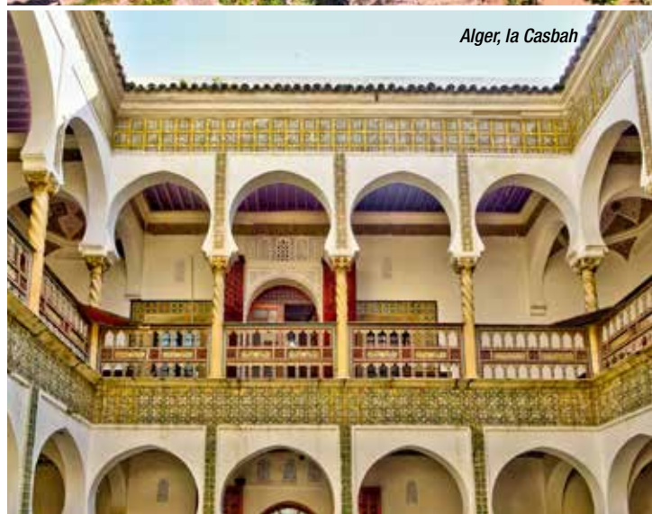
Alger, la Casbah